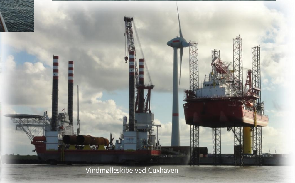
Vindmølleskibe ved Cuxhaven