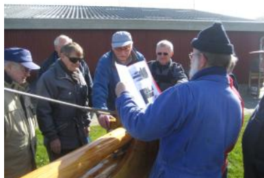
Manualen læses, hvor er det nu lige det vant skal placeres