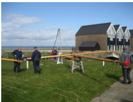
Masten samles der skal mange hænder til