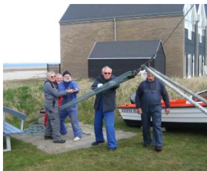
Masten rejses vanterne fastgøres. Og så er der øl og suppe bagefter. Man skulle ikke tro at den er 30 år.