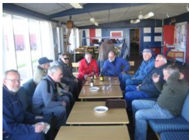
Morgenmøde der planlægges

Uden alle de frivillige var den nok ikke så flot !