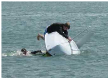
Det går ikke altid som man gerne ville.

Næste deadline 05. September -bladet udkommer i uge 37.