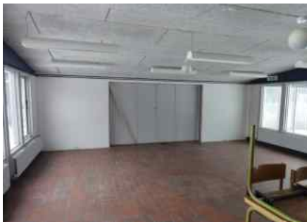
Den nye brandmur i Mågelokalet