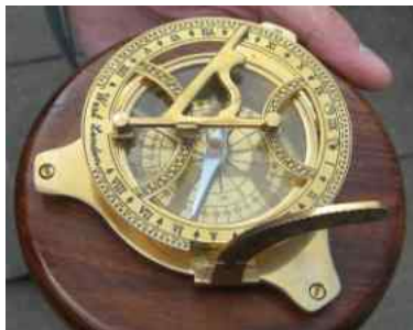
HVAD ER DET?

Næste Deadline 20. September oktober bladet udkommer uge 40