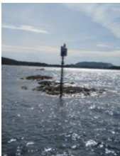
Et rødt sømærke

Denne sommer var vi igen heldige, for den uge i juni vi var i Florø, skinnede solen hele tiden og flot vand at sejle på, så det blev nok den mest solrige sejltur vi havde i 2007.